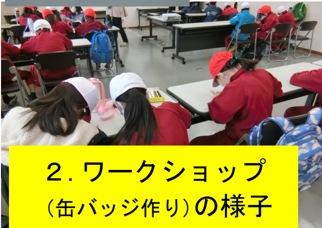
2. ワークショップ（缶バッジ作り）の様子