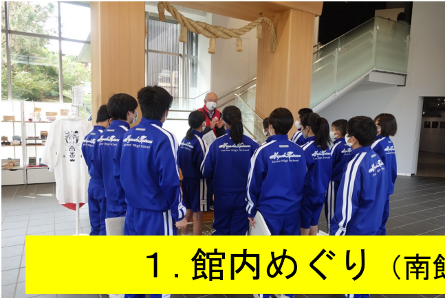
1. 館内めぐり（南館ガイド付き見学）の様子